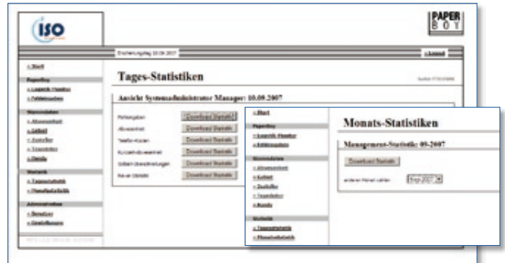
Statistiken: für die einzelnen Unternehmensebenen

Gerne bieten wir Ihnen den gesamten Service aus einer Hand an: Hardware, Software und Hosting.