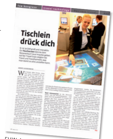
FVW-Artikel (Ausgabe 20/2009, Seite 46) zur ISO Surface Applikation

Melden Sie sich bei uns, tauchen Sie ein in die Welt von Microsoft Surface und starten Sie mit uns gemeinsam in die Zukunft des Reisevertriebs.